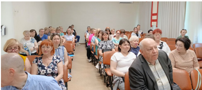
Участники районного профсоюзного семинара по охране труда