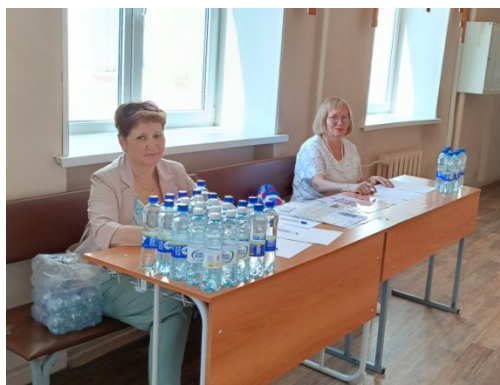
Регистрация участников семинара

Педагог показала, как нетрадиционно можно провести мероприятие по охране труда в формате викторины, близ-опроса, выявления нарушений по охране труда в специально созданных ситуациях на примере русских народных сказок.