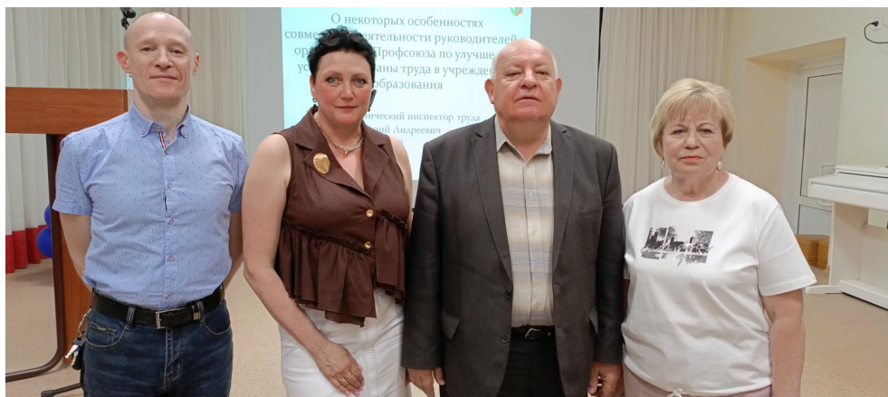
Модераторы районного профсоюзного семинара